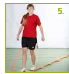
▶ Balancieren rückwärts