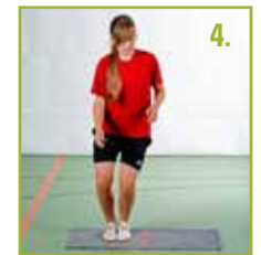
▶ Seitlich Hin- und Herspringen