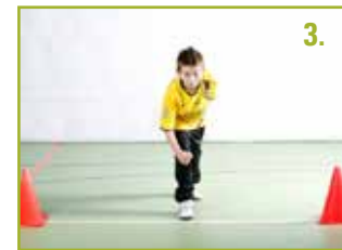
▶ 20m Sprint